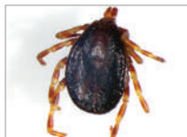
3d. Hyalomma marginatum