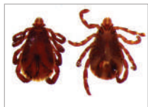
3b. Rhipicephalus sanguineus