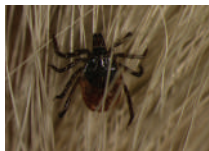
3a. Ixodes ricinus

Limitatamente alle zecche dure, le specie più comuni sono la zecca dei boschi ( Ixodes ricinus ) (fig. 3a) e la zecca del cane ( Rhipicephalus sanguineus ) (3b). Altre specie meno comuni sono Dermacentor marginatus (3c) e Hyalomma marginatum (3d).