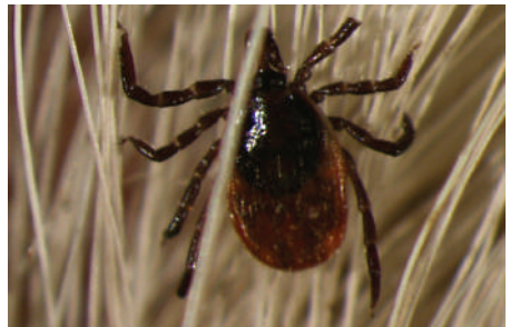
2. Ixodidi (zecche dure)