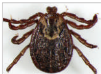
3c. Dermacentor marginatus