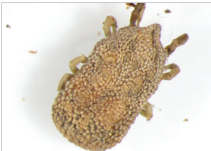
1. Argasidi (zecche molli)

Le zecche appartengono allo stesso gruppo tassonomico dei ragni e scorpioni e sono dello stesso ordine degli acari. Esistono circa 900 specie di zecche, tutte parassite che si nutrono di sangue. In Italia sono presenti 40 specie suddivise in due famiglie: Argasidi (7 specie) e Ixodidi (33 specie). Gli argasidi sono anche conosciuti come zecche molli e parassitano soprattutto gli uccelli, mentre le zecche dure parassitano tutti i vertebrati, in particolare i mammiferi. Le differenze biologiche e morfologiche sono mostrate nelle figure seguenti (fig.1: argasidi; fig.2: ixodidi).